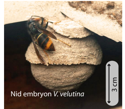
Nid embryon V. velutina

Au printemps, chaque reine fondatrice construit seule son nid dans un lieu souvent protégé. Chez la plupart des guêpes le nid embryon ressemble à une petite sphère de 5 à 10 cm de diamètre avec une ouverture vers le bas. Chez les frelons, la colonie n'hésitera pas à déménager si l'emplacement ne convient plus (manque de place, de sécurité).